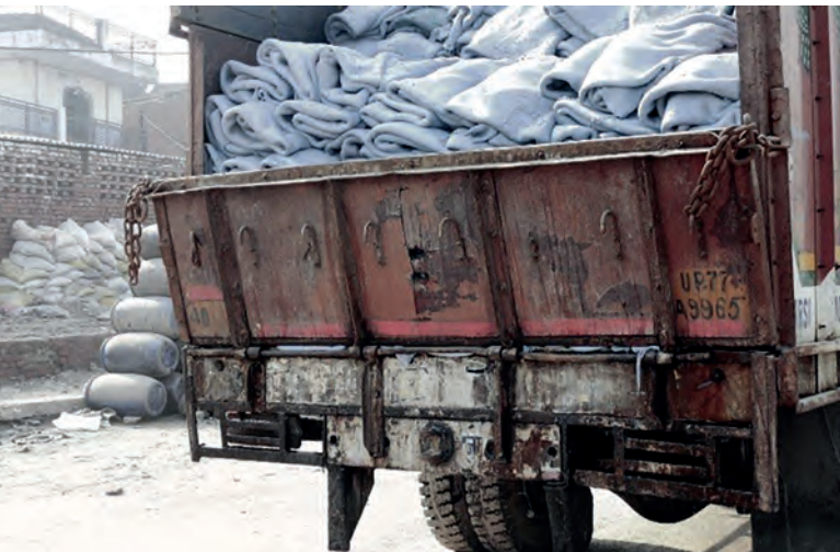
Ein Laster voller Leder-Zwischenprodukte, am Straßenrand stapeln sich die Chemikalienfässer (hier in Indien).

Nicht nur die Zulieferer im Ausland, sondern auch die einkaufenden Unternehmen in Deutschland könnten sich besser