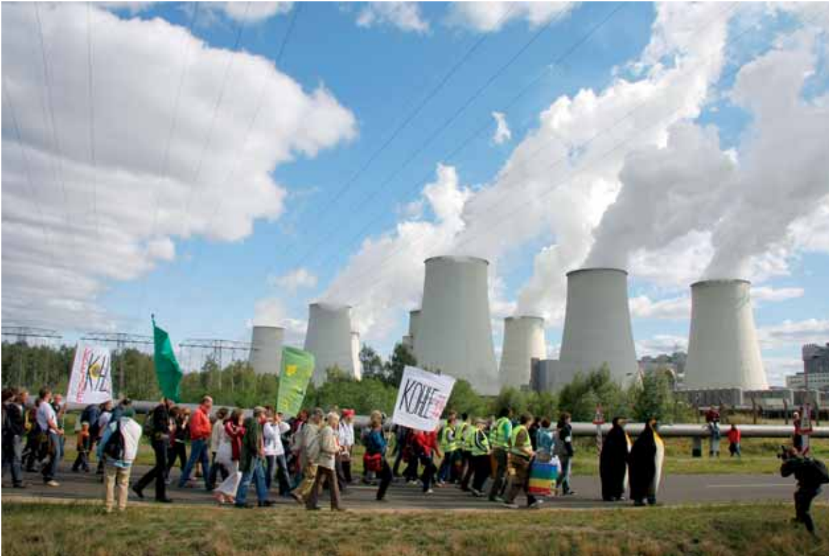
Demonstration in Jämschwalde gegen Kohlekraftwerke

Wirtschafts- und Finanzkrise an Fahrt gewonnen. Die Medien nehmen die Frage auf, inwieweit das Bruttoinlandsprodukt als Indikator für Wohlstand geeignet sei. Der Verdacht keimt, dass wirtschaftliches Wachstum nicht ad infinitum fortgeschrieben werden könne. Ein einfacher Blick auf die Zahlen unterstützt die um sich greifende Skepsis: Wächst die Wirtschaft jährlich um 1%, verdoppelt sich die Produktion in 72 Jahren, sind es 3%, schrumpft der Zeitraum bis zur Verdoppelung auf 23,5 Jahren, bei 4% sind es 18 Jahre ( Diefenbacher 2007: 33 ).