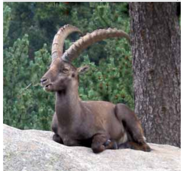
Wie misst man den Wert von Natur und Tierwelt?

Mit Hilfe der Berechnung der Kapitalausstattung soll dargestellt werden, ob Deutschland genügend in die Produktionsmittel (Anlagen und Gebäude) investiert, um zumindest den aktuellen Standard zu erhalten. Dies geschieht derzeit. Der letzte Wert schließlich erfasst, ob Deutschland