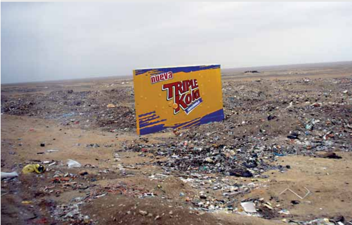
Illegale Müllkippe in Peru: Aufräumarbeiten könnten das Bruttoinlandsprodukt erhöhen

auf Kosten von anderen Ländern gründet. Die Antwort besteht in einer 600 Seiten starken Stu- die mit detaillierten Analysen und zahlreichen Hinweisen.