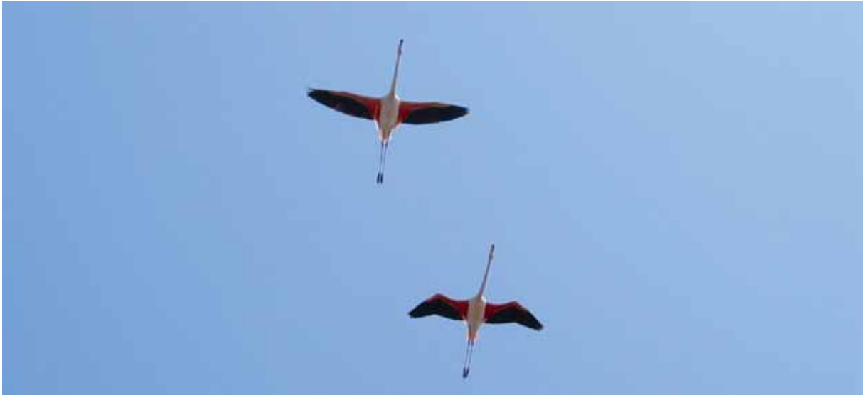
Kein ökonomischer Wert – und dennoch ein schöner Anblick