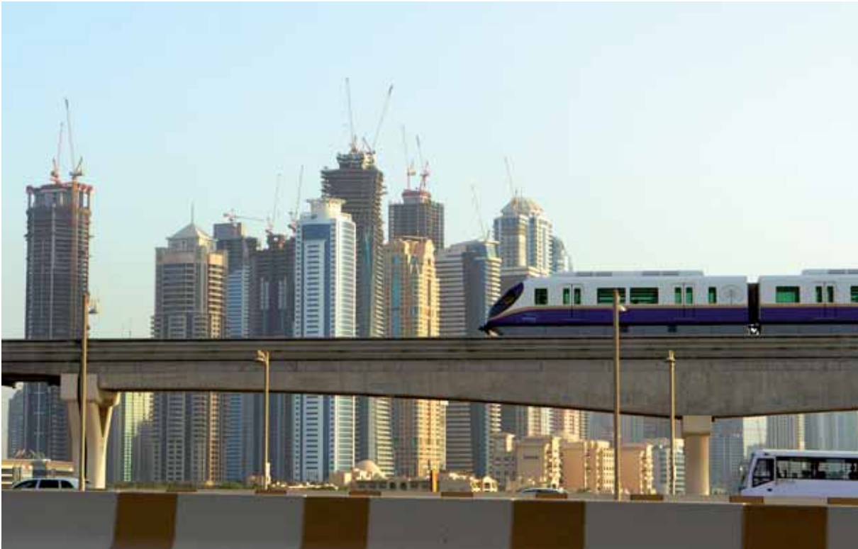
Höher, schneller, weiter – Dubais Modernisierungskurs führte das Land an den Rand des Bankrotts

nicht zur Verbesserung ihrer Lebensverhältnisse beigetragen. Von dem massiven Wachstum des Bruttoinlandsprodukts der Weltwirtschaft zwischen 1990 und 2001 sind je 100 US-Dollar Zuwachs nur 1,3 US-Dollar bei den Menschen angekommen, die von weniger als einem US-Dollar pro Tag leben müssen, und 2,8 US-Dollar bei denen, die täglich zwischen 1 und 2 US-Dollar zur Verfügung haben. Anders gesagt: Mehr als 97 Prozent des Zuwachses kamen nicht den Ärmsten zugute. Um deren Bedürfnisse durch ein Wachstum der weltweiten Produktion zu befriedigen, sind somit enorm hohe Wachstumsraten erforderlich, da nur ein sehr kleiner Teil des Zuwachses bei ihnen ankommt. Allein durch eine Steigerung der Produktion wird es somit nicht möglich sein, die Armut nachhaltig zu lindern, ohne die Grundlagen menschlichen Lebens auf der Erde zu zerstören. Daher kann eine Verbesserung der Situation der Armen nur durch Umverteilung erreicht werden (Woodward/Simms 2006 16 f.).