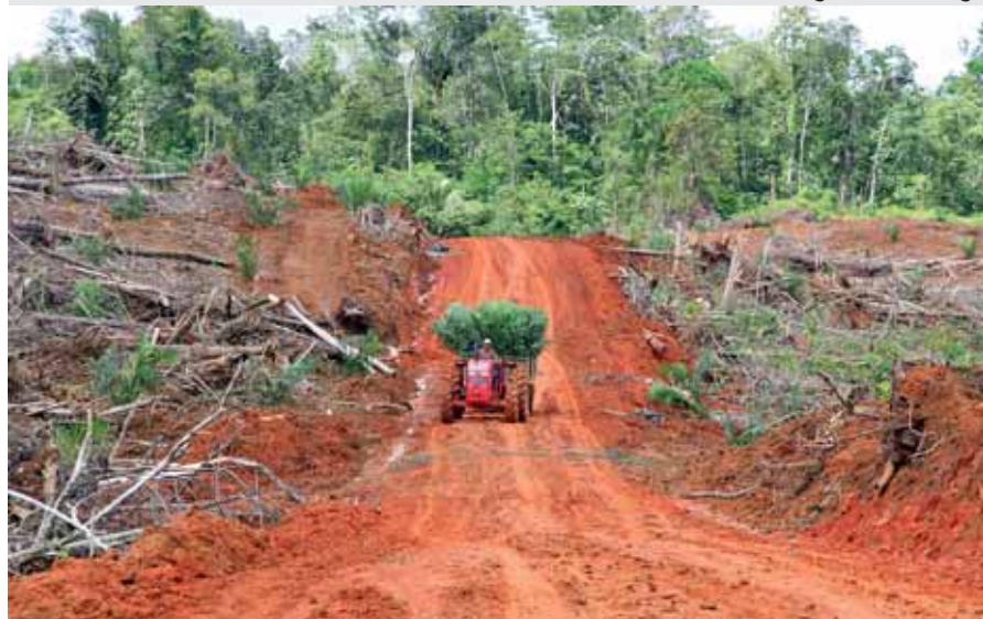
Esmeraldas, Ecuador: Regenwaldrodung zur Anlage von Palmölmonokulturen