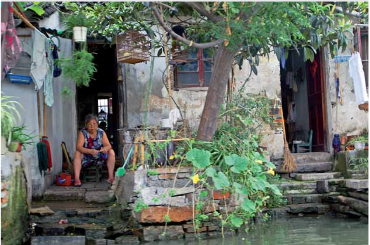
Hinterhof in der boomenden Metropole Schanghai, China