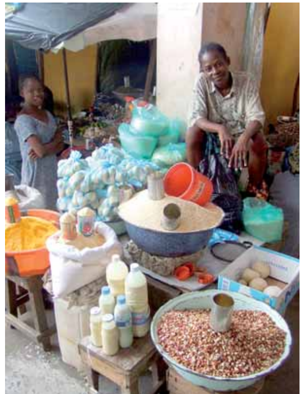
Informeller Sektor in Ghana