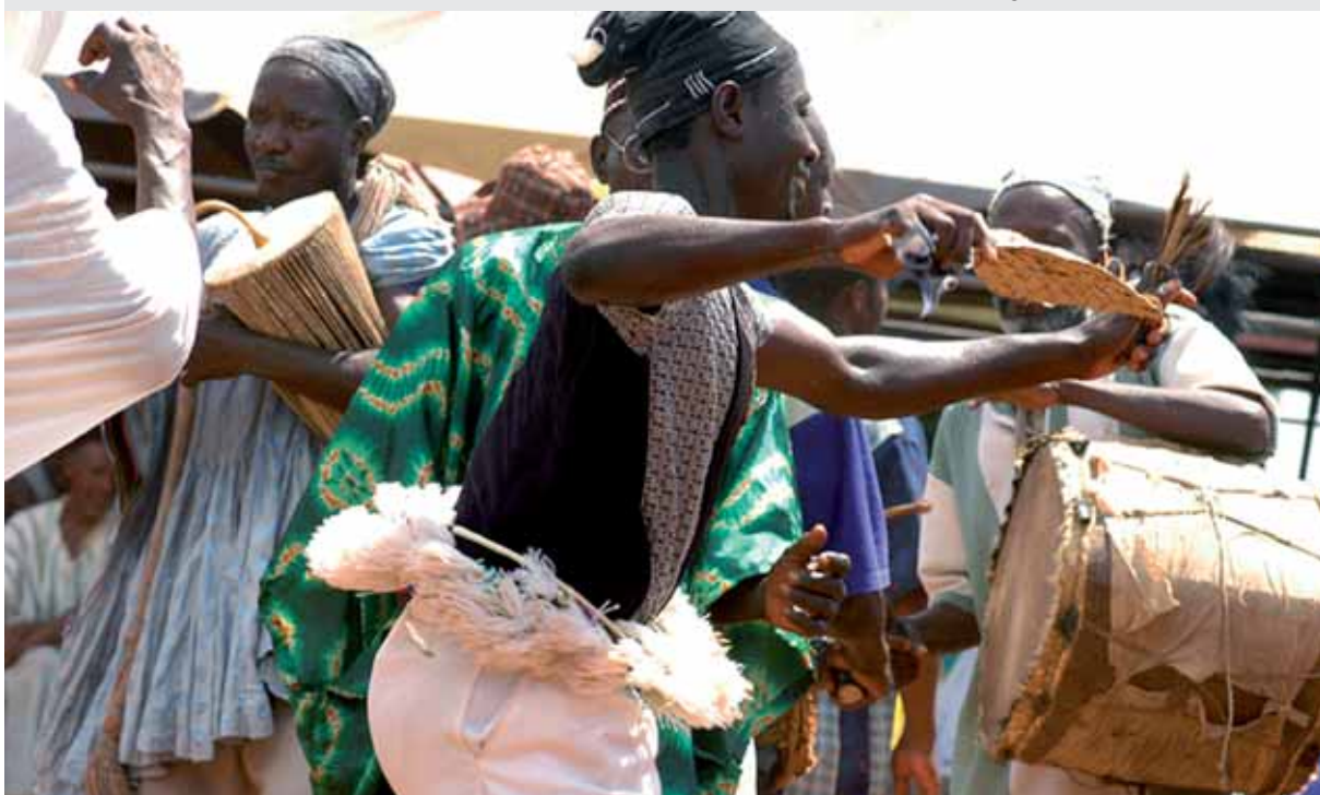
Im armen Norden Ghanas: Glücksmomente trotz schwacher Wirtschaftsleistung

Dennoch weist der HDI noch große Leerstellen auf. Ökologische Aspekte werden nicht erfasst, und die politische Situation im Lande spiegelt sich in den Daten nur indirekt wieder, da Mängel bei Gesundheit und Bildung auf Fehler in der Sozialpolitik und bei der Verteilungsgerechtigkeit schließen lassen. Dabei bleiben viele wichtige Aspekte, wie z.B. politische Freiheiten oder das Vorhandensein von persönlicher Sicherheit, unberücksichtigt.