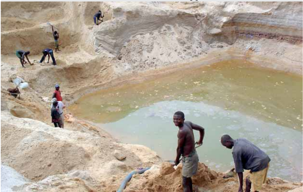
Diamantenabbau in Sierra Leone: Kurzfristig erzielte Einnahmen basieren auf der Zerstörung großer Flächen