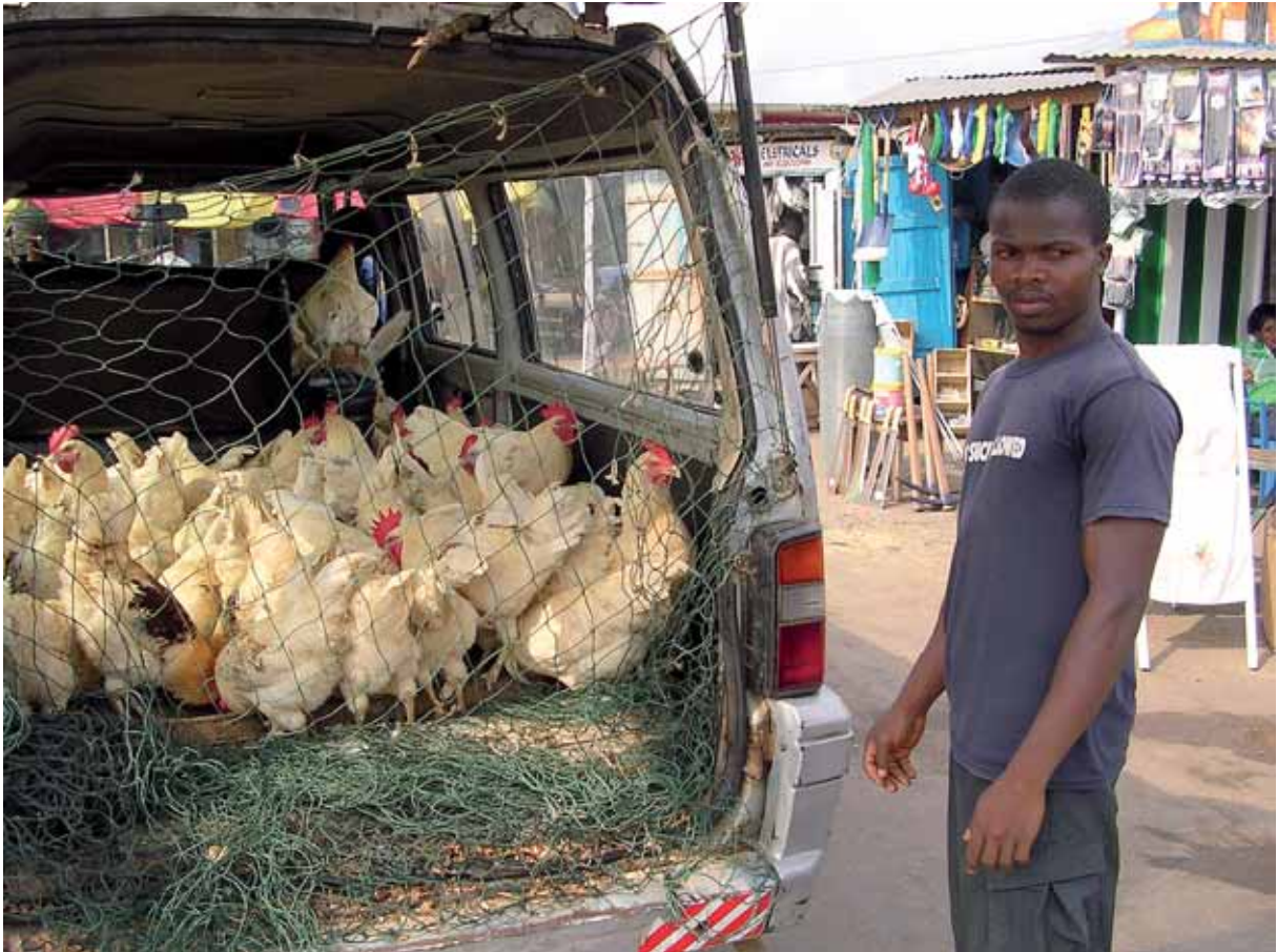
Ghana: Wer erfasst die Wirtschaftsleistung der Kleinproduzenten?

Jedoch handelt es sich hierbei nicht um einen abgeschlossenen Katalog von Ge- und Verboten, um eine Rezeptur für Zukunftsfähigkeit. Die beteiligten Organisationen wollen, so der Untertitel, eine gesellschaftliche Debatte anstoßen. In einem Punkt gelingt dies besonders: In der Fra-