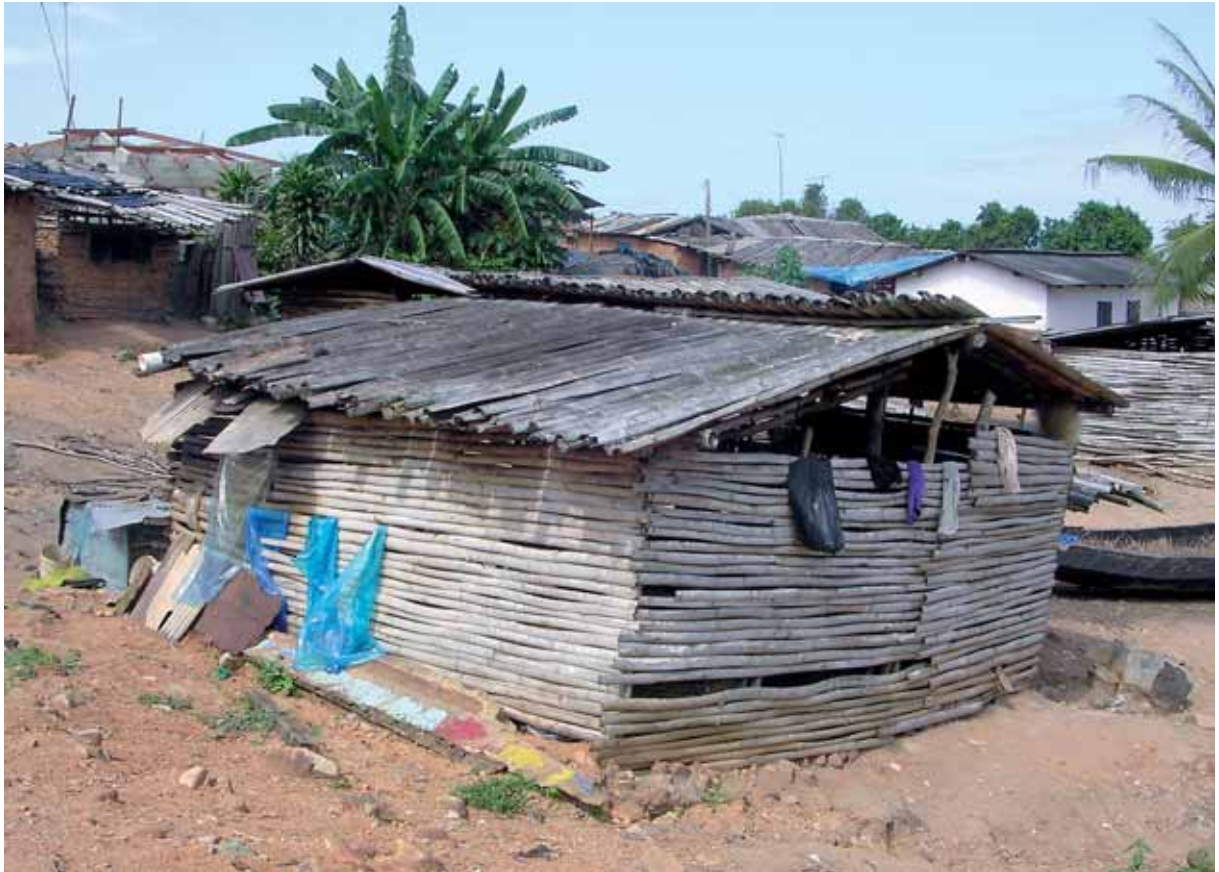
Welche Art von Wachstum könnte den Bewohnern der Hütte helfen?

Dabei wird unterstellt, dass Wachstum auch ein Mehr an Wohlergehen bedeutet. Jedoch steckt hinter der Frage, wie man Wohlergehen misst, auch die Frage, was Wohlergehen eigentlich ist. Oder, kürzer: Was ist ein gutes Leben? Dies umfasst offensichtlich mehr als materiellen Reichtum.