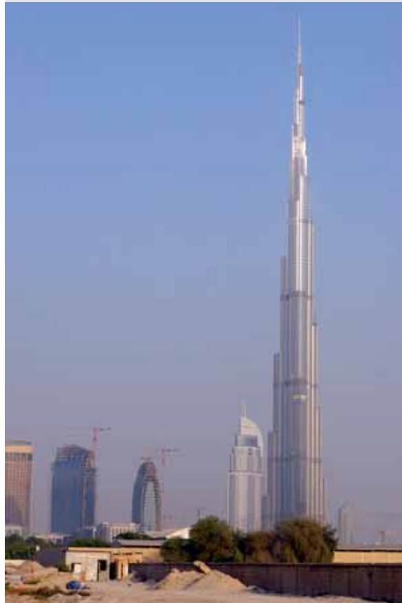
Höchster Wolkenkratzer der Welt im Wüstensand Dubais