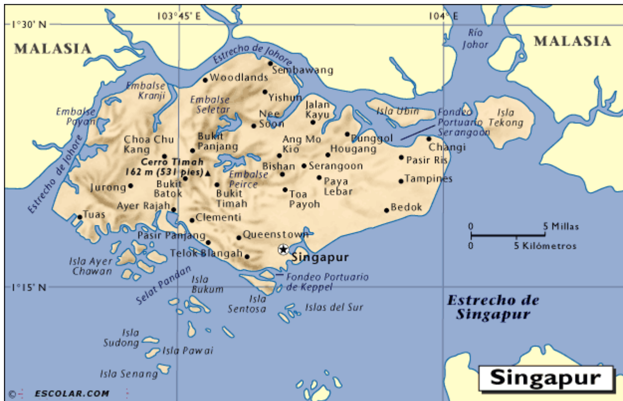
Figura 1: Mapa de Singapur

De relevancia para el éxito de Singapur es sin lugar a dudas su orientación hacia afuera y la capacidad de integrarse a la economía mundial. Además del momento histórico único e irreplicable en el que logra aplicar su estrategia: Esta integración al mercado mundial ocurre en un momento en que las compañías transnacionales se veían confrontadas a las estrategias de sustitución de importaciones e industrialización local de muchas naciones vecinas. Por otro lado, cuando Singapur se separa de Malasia en 1965, perdió el país una retaguardia de recursos naturales importante y se vio amenazado directamente por la intervención militar de Indonesia. Las características del despegue económico de Singapur pueden ser enumeradas de la siguiente manera: 8