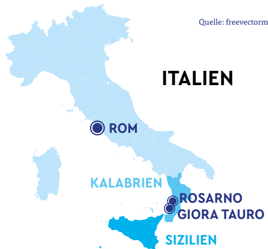
KARTE 1: ITALIEN

Sklavenähnliche Arbeitsverhältnisse auf den Plantagen sorgten in den vergangenen Jahren immer wieder für Schlagzeilen: 2010 protestierten in Rosarno, einer Stadt nahe der Ebene von Giora Tauro, 2.000 afrikanische Saisonarbeiter gegen ihre unmenschlichen Arbeits- und Lebensbedingungen, nachdem zwei italienische Jugendliche einen Arbeiter erschossen hatten. Die Bevölkerung des Orts reagierte mit Angst und Gewalt auf die Protestierenden. 66 Menschen wurden bei den Auseinandersetzungen zum Teil schwer verletzt.