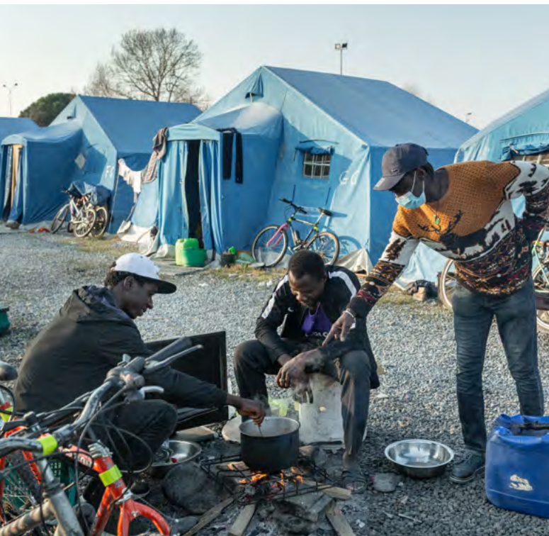
Im Camp kochen die Erntehelfer gemeinsam im Freien über offenem Feuer.

Zivilgesellschaft bekannt werden, finden keine Berücksichtigung in der Bewertung. So kommt es immer wieder zu Zertifizierungen von Agrarbetrieben, denen sogar Strafverfahren anhängig sind.